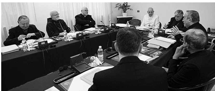
教宗出席了枢机咨议会。

在本次会议中，「厘清了新版宗座宪章的咨询程序；众所周知，这份文件的标题暂定为《你们去宣传福