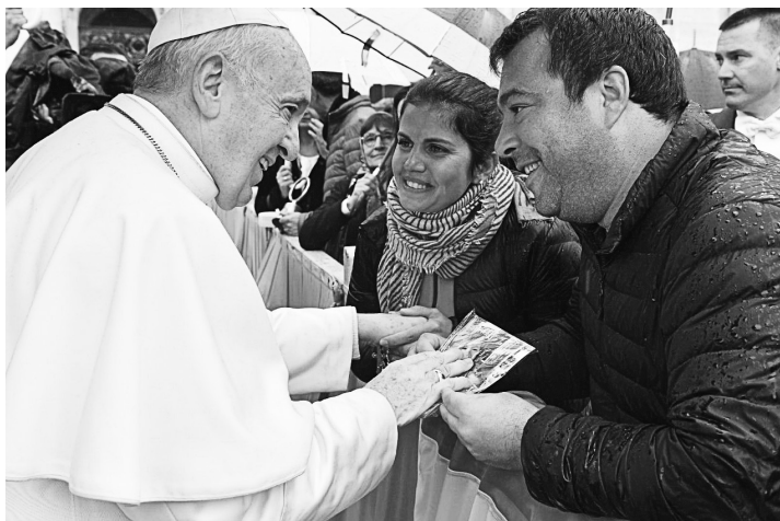
教宗亲切地接见朝圣者

教宗表明，罪过有能看到的，也有看不到的，即隐藏的罪过，其中最严重的是“傲慢”。“傲慢也能传染给虔诚信仰生活的人。早在1600年-1700年杨森主义时期，有一个闻名的女修院，修