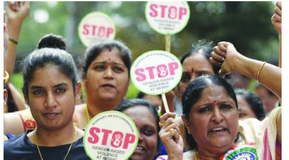
இந்தியாவில் பெண்ணுரிமைக்காக போராட்டம்

பெண்ணுரிமை பேணப்பட வேண்டும் என்பது இவரின் முக்கியமாக உள்ளது.