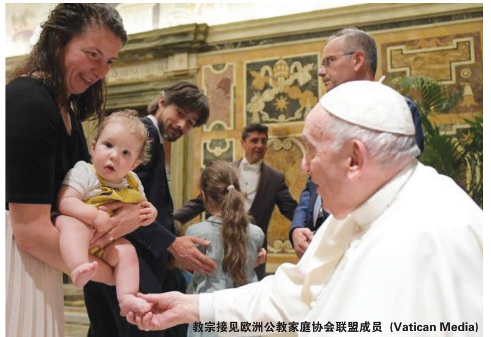
教宗接见欧洲公教家庭协会联盟成员 (Vatican Media)

在这次会晤中，教宗谴责了「泯灭人性且愈加猖獗的『出租子宫』行径」。把子宫出租的妇女「通常很穷困，她们遭到剥削，孩童被当作商品对待」。此外，教宗也谴责了那「借由互联网如今传得到处都是的」色情影像，称它「长久以来攻击男女的尊严」。「这不仅关乎保护孩童，是有关当局和我们大家的迫切任务，更要表明色情影像危害公众健康」。家庭应当与学校和当地团体合作，「预防