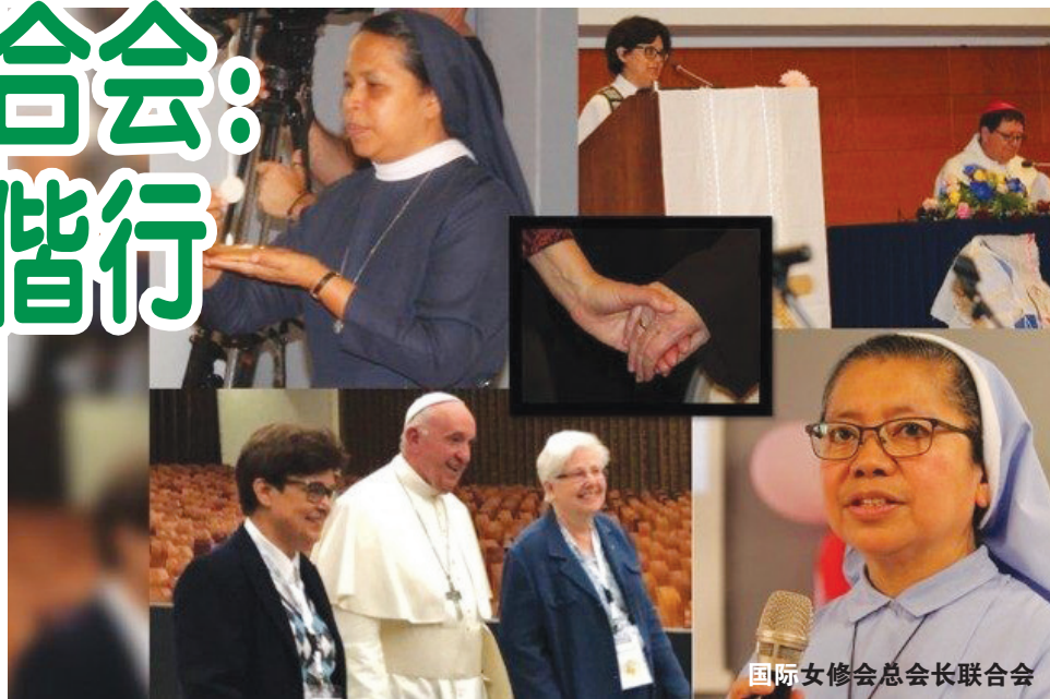
国际女修会总会长联合会

国际女修会总会长联合会成立于1965年，其成员约1900位女修会总会长，这些修女会的总会院分布在97个国家，其中：25个欧洲国家，16个亚洲国家，30个美洲国家，22个非洲国家和4个大洋州国家。