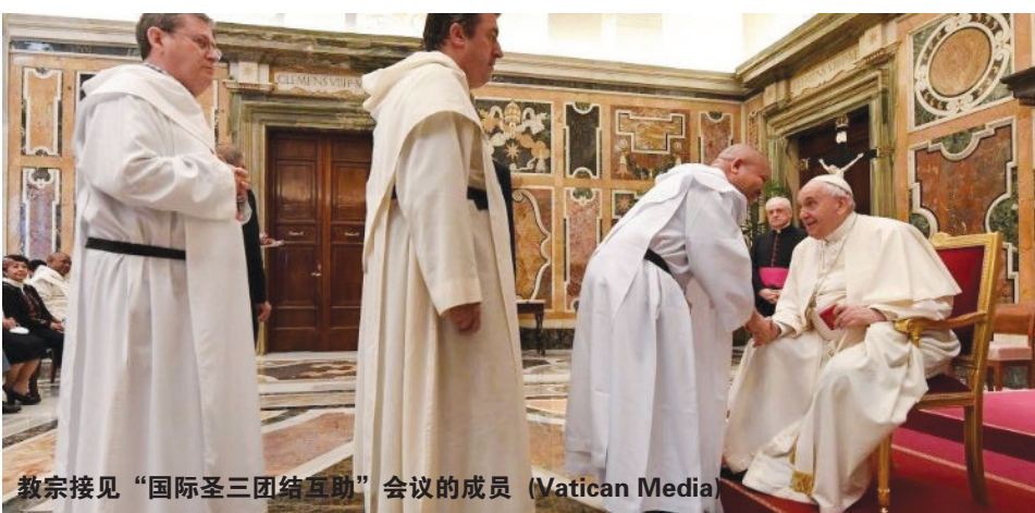
教宗接见“国际圣三团结互助”会议的成员

教宗回顾了圣三赎虏会创始人圣若望玛达（St. John of Matha）的见证，他“蒙基督的召叫，为解救包括基督徒和穆斯林在内的奴隶而奉献一生”。教宗说：“他不愿意单独做这事，而是为此目的创建了一个新修会，一个“走出去的