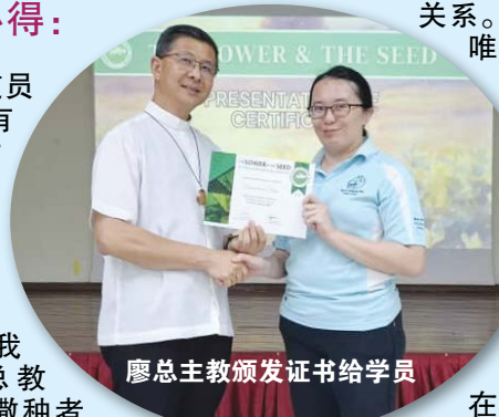
廖总主教颁发证书给学员

然而，实际执行时并不容易。在我负责的加影圣家堂中文组坚振班中，学生来自不同家庭背景，有的家庭有稳定的信仰生活，而有的则几乎没有。这使得带领他们接触耶稣都已颇费心力，更遑论引导他们与耶稣建立亲密