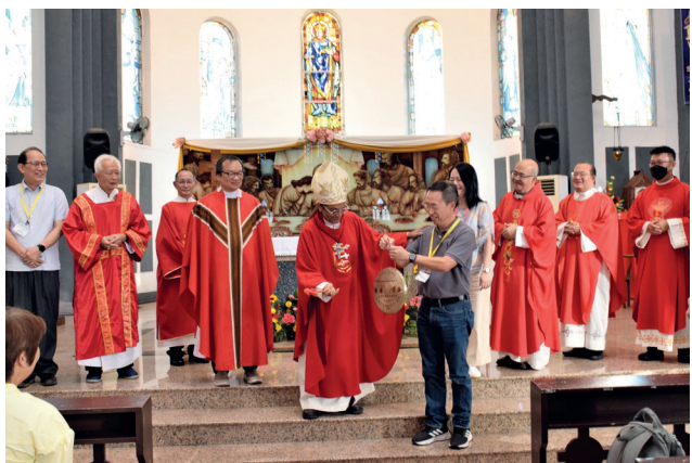
四教区讲习会在太平圣雷士天主堂以鸣锣声宣告了讲习会的正式开启。