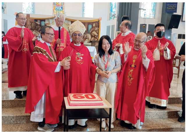
四教区讲习会50周年纪念 - 切蛋糕仪式