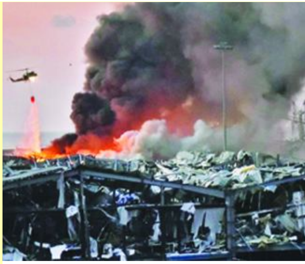
பெய்ரூட் நகரில் நிகழ்ந்த வெடிப்பில் அழியும் நகரம்

இந்த பெய்ரூட் பயங்கர நிகழ்வைத் தொடர்ந்து