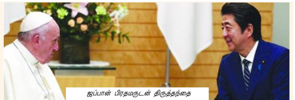
ஜப்பான் பிரதமருடன் திருத்தந்தை

பாதுகாப்பு, அமைதி, மற்றும், நிலையான தன்மைக்குரிய மனித ஏக்கத்திற்கு அணு ஆயுதம் தீர்வைத் தரமுடியாது என, திருத்தந்தை பிரான்சிஸ் அவர்கள், கடந்த ஆண்டு, ஜப்பானில் மேற்கொண்ட திருத்தாது பயணத்தின்போது எடுத்துரைத்ததை சுட்டிக்காட்டியுள்ள இந்த மறைபோதக சபை, இன்றைய உலகில், இலட்சக்கணக்கான குழந்தைகள் உணவை உணவின்றி வாடும்போது, கோடிக்கணக்கான பணத்தை அணு ஆயுத தயாரிப்பு, மேம்பாடு, மற்றும், அணு ஆயுத வர்த்தகத்தில் வீணடிப்பது தவறு என்று திருத்தந்தை கூறிய வார்த்தைகளையும்