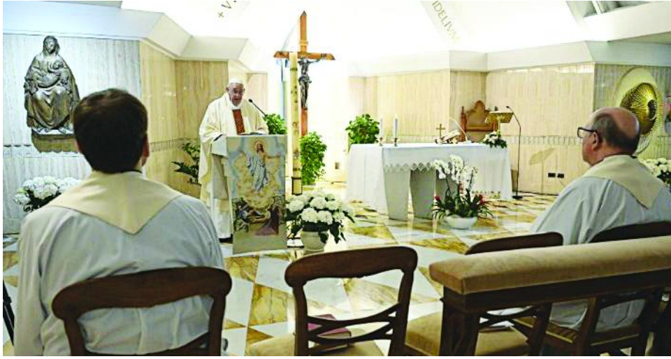
சாந்தா மார்த்தா சிற்றாலய திருப்பலி - 21-04-20

இந்த கொள்ளை நோய் காலத்தில் நிலவும் மிகுந்த அமைதிச் சூழல், நமக்குச் சற்று புதியதாக இருந்தாலும், இந்த வாய்ப்பைப் பயன்படுத்தி, நாம் செவிசாய்ப்பதில் வளரும் திறனுக்காக ஆண்டவரை மன்றாடுவோம் என்று, கடந்தச் செவ்வாய் காலை திருப்பலியைத் துவக்கினார், திருத்தந்தை பிரான்சிஸ்.