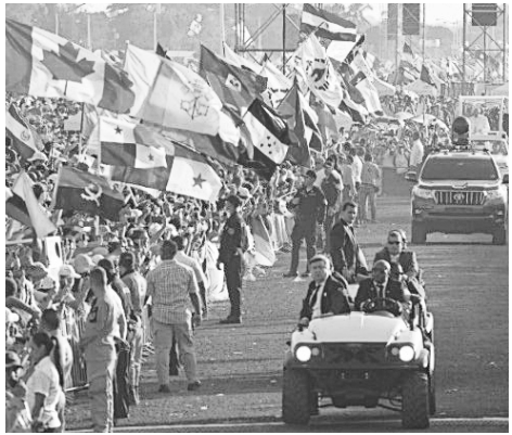
பானமாவில் உலக இளைஞர் தினம், 2019

திருத்தந்தை பிரான்சிஸ் அவர்கள், பொதுநிலையினர், குடும்பம் மற்றும், வாழ்வு