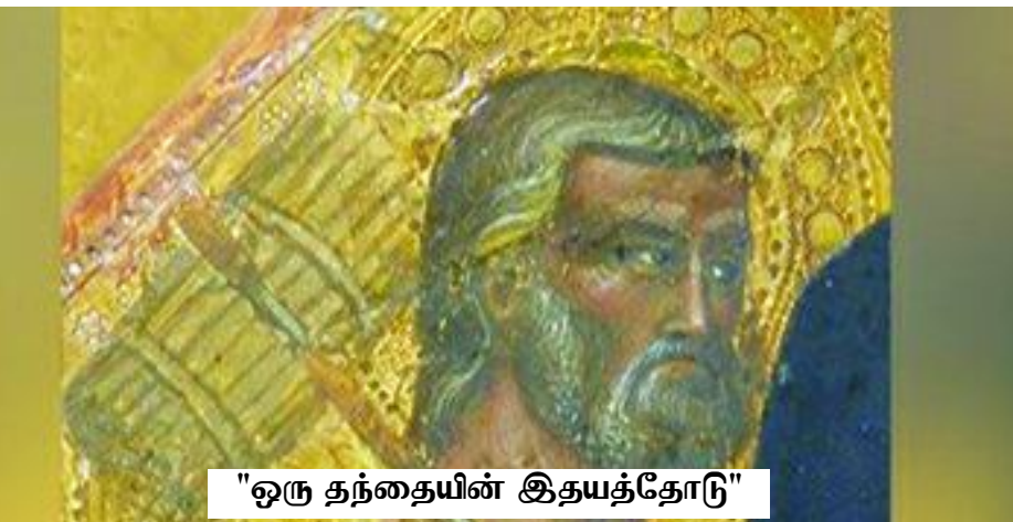
“ஒரு தந்தையின் இதயத்தோடு”

“ஒரு தந்தையின் இதயத்தோடு” என்ற தலைப்பில் திருத்தந்தை மடல் ஒன்றை வெளியிட்டு, புனித யோசேப்பு ஜூபிலி ஆண்டு ஒன்றையும் அறிவித்துள்ளார்.