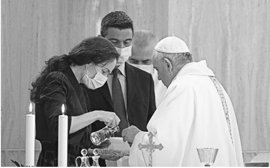
திருத்தந்தை நிறைவேற்றும் திருப்பலியில் பீடப் பணியாளராக உதவி செய்யும் பெண்

சனவரி 11, கடந்தத் திங்களன்று வெளியிட்டுள்ளார். உலகின் பல்வேறு தலத்திருஅவைகளில், ஏற்கனவே, திருப்பலிச் சடங்குகளில், நடைமுறையில் இருக்கும், பெண்களின் பங்கேற்பை, தற்போது, அதிகாரப்பூர்வமாக அங்கீகரிக்கும் இந்த Motu Proprio அறிக்கைக்கு, "Spiritus Domini," அதாவது, ஆண்டவரின் ஆவி, என்று பெயரிட்டுள்ளார், திருத்தந்தை பிரான்சிஸ்.