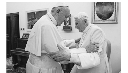
திருத்தந்தை பிரான்சிஸ், முன்னாள் திருத்தந்தை 16ம் பெனடிக்ட்