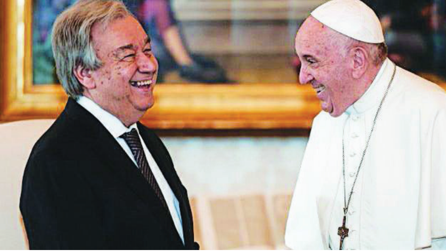
திருத்தந்தை பிரான்சிஸ், ஐ.நா.பொதுச்செயலர் அந்தோனியோ கூட்டேரஸ்

முகநூல் பக்கம் வழியாக அல்ல, மாறாக, முகத்துக்கு முகம் பார்த்துச் சொல்லப்படும் கதைகளால், மக்களிடையே உறவுகள் வளரவேண்டும் என்று திருத்தந்தை விடுத்துள்ள விண்ணப்பத்தை, கர்தினால் போ அவர்கள் மீண்டும் நினைவுறுத்தியுள்ளார். (UCAN)