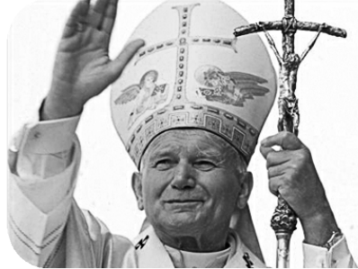
புனித திருத்தந்தை 2-ஆம் ஜோன் பவுல்