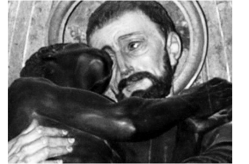
புனித பீட்டர் கிளேவர்

1580-ம் ஆண்டு, இஸ்பெயின் நாட்டில் பிறந்த பீட்டர் கிளேவர் அவர்கள், தன் 20-வது வயதில், இயேசு சபையில் சேர்ந்து,