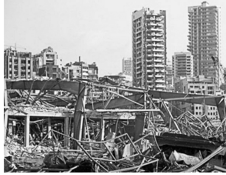
பாதிக்கப்பட்ட பெய்ருட்டின் ஒரு பகுதி

கோலாலம்பூர்: மலேசியாவின் கத்தோலிக்க ஆயர்கள் பேரவை குட் ஷெப்பர்ட் அனைத்துலக அறவாரியத்தின் வழியாக பெய்ருட்டில் ஏற்பட்ட வெடிப்பில் பாதிக்கப்பட்ட மக்களின் நலவாழ்வுக்கு நிவாரண நிதியுதவி வழங்கியது.