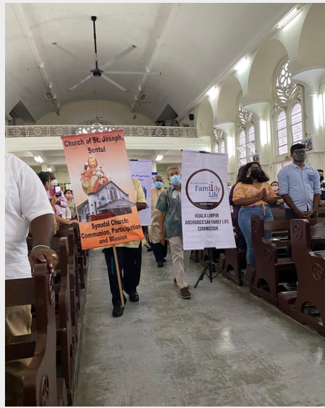
பதாகைகள் ஏந்திய தொடக்கப் பவனி

காக்கவும் நாம் மன்னிக்க கற்றுக்கொள்ள வேண்டும். "குடும்ப வாழ்க்கையில் நமக்கு ஏற்படும் போராட்டங்கள் மற்றும் பதட்டங்களை அறிந்திருப்பதால், திருத்தந்தை பிரான்சிஸ் 'குடும்ப அன்பு: இறையழைத்தல் மற்றும் தூய்மைக்கான வழி' என்ற கருப்பொருளைத் தேர்ந்தெடுத்தார். நம்மில் எழும் பதட்டங்கள் மற்றும் கருத்து வேறுபாடுகள் ஆகியவற்றின் மத்தியில் தான் மற்றவர்களின் தேவைகளை முன் வைத்து தூய்மை வாழ்வுக்கு முன்னேறுகிறோம்" என்றார்.