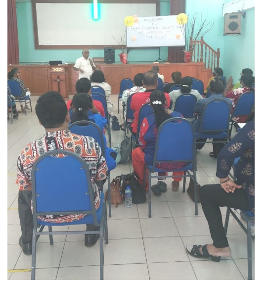
பயிற்சியில் பங்கேற்ற ஒரு பகுதியினர்

நிறைவாக, திருவழிபாடு பற்றிய அடிப்படை கேள்விகளுக்கு அவர் பதிலளித்து பயிற்சியை