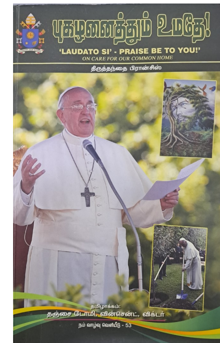
'Laudato si' 2015

ஒருபோதும் ஏமாற்றமடைய மாட்டார்கள் என்பதற்கேற்ப திருத்தந்தையின் பதினொன்றாவது ஆண்டை நோக்கிய பயணத்தில் நாமும் நம்பிக்கையுடன் வாழ்வோம். திருத்தந்தைக்காகவும் அவரது உடல் நலன் மற்றும் பணிக்காகவும் சிறப்பாக இறைவேண்டல் செய்வோம். உயிர்த்த இறைவனின் சாயல் கொண்ட நம்பிக்கை நம் வாழ்வையும் செழிப்பாகக் கட்டும்.