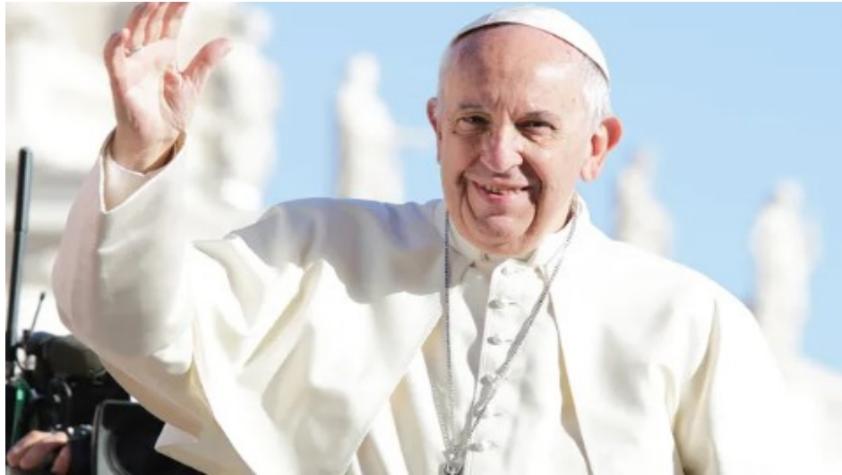
2013-ல் திருத்தந்தையாகத் தேர்வுப்பெற்ற போது

இதுவரை ஐந்து சினோடல் என்னும் ஒருங்கிணைந்த பயணக் கூட்டங்களை நடத்தியுள்ள திருத்தந்தை பிரான்சிஸ் அவர்கள், 2014 மற்றும் 2015 ஆண்டுகளில் குடும்பங்களுக்காக, இரண்டு, 2018 ஆண்டில் இளைஞர்களுக்காக ஒன்று, 2019 ஆம் ஆண்டில் Pan-Amazon பகுதிக்கு ஒரு சிறப்பான சினோடலையும் வழிநடத்தியுள்ளார். இறுதியாக 2023 ஆண்டிற்கான ஏற்கனவே அறிவிக்கப்பட்ட ஆயர்கள் மாமன்றத்தையும் வழிநடத்த உள்ளார். 2025 ஆண்டிற்கான ஜூலி ஆண்டானது ஏற்கனவே அறிவிக்கப்பட்டபடி, நம்பிக்கையின் திருப்பயணிகள் என்ற கருப்பொருளில் கொண்டாடப்பட உள்ளது.