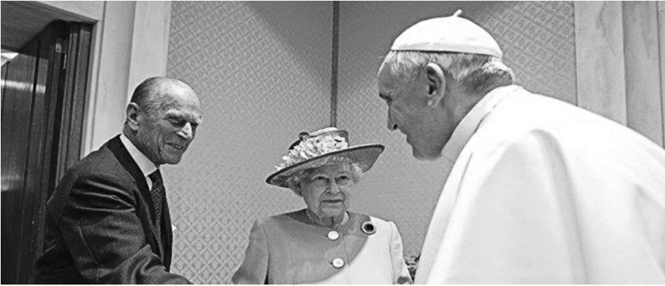
திருத்தந்தை பிரான்சிஸ், பிரிட்டன் அரசி இரண்டாம் எலிசபெத், கோமகன் பிலிப்

மேலும், இங்கிலாந்தின் வெஸ்மினிஸ்தர் போராயர் கர்தினால் வின்சென்ட் நிக்கோஸ் அவர்களும், இளவரசர் பிலிப் அவர்களின் கடமை தவறாத, நேர்மையான வாழ்வைப் பாராட்டியுள்ளதோடு, அரசு