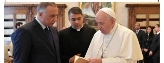
திருத்தந்தையுடன் ஈராக் பிரதமர் முஸ்தாபா அல்-கதிமி

இவ்வாண்டு மார்ச் மாதம் 5ம் தேதி முதல் 8ம் தேதி வரை திருத்தந்தை பிரான்சிஸ் அவர்கள், ஈராக்கில் திருத்தூதுப் பயணம் மேற்கொண்டதன் பலனாக இச்சந்திப்பு வத்திக்கானில் நடைபெற்றது வரலாற்றில் ஒரு மைல் கல்லாகும்.