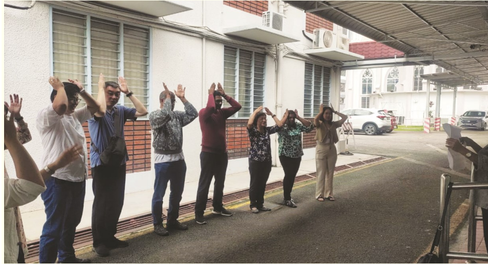
மறைக்கல்வி ஆசிரியர் பங்கேற்ற சோர்வகற்றும் அதிரடி பயிற்சி

இந்த பத்து மாத பாடத்திட்டம் கத்தோலிக்க திருஅவையின் மறைக்கல்வி நூலின் நான்கு பகுதிகளை உள்ளடக்கியது. அவை: நம்பிக்கை அறிக்கை (நம்பிக்கை), 'மறை உண்மைகளைக் கொண்டாடுதல்' (கிறிஸ்துவில் வாழ்வு), கிறிஸ்தவ நன்னெறி வாழ்க்கை (கட்டளைகள்) மற்றும்