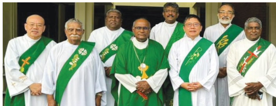
ஆயரோடான ஒரு நாள் சந்திப்பில் பங்கேற்ற நிரந்தர திருத்தொண்டர்கள்

எளிதாக்குவதை நோக்கமாகக் கொண்டது. இது நிரந்தர திருத்தொண்டர் மத்தியில் ஒன்றிப்பு மற்றும் ஆயரோடான பயன்மிகு